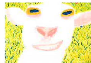
文部科学大臣奨励賞受賞作品