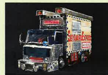
「トヨタトヨエース2t冷凍車」はら かずき