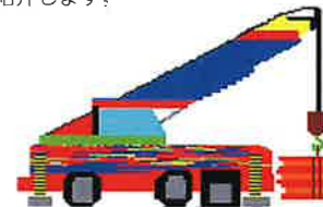
厚生労働大臣賞受賞作品

身体の不自由を補う工夫や努力をし ながら創作活動に励んでおられる 方々の作品を全国から募集し、毎年 「肢体不自由児・者の美術展/デジタ ル写真展」を開催しております。今回 は、令和2年度の特賞受賞作品28点 を紹介します。