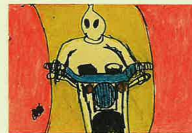
「宇宙人の暮らし」宇根 正浩