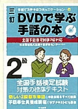
左/「これで合格! 2023 全国手話検定試験 (DVD付き)」 右/「DVDで学ぶ手話の本シリーズ」 5～2級 [三訂版]・準1級1級 [改訂版]