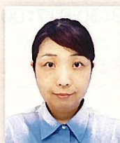
聴覚障害をもつ医療従事者の会代表

出会う・間違ってもいいから話す・思いが通じる! どんな言語も、この感動から一歩が始まるのだと思います。検定は、級ごとに自分の進度も見え、楽しみながら手話を学べる方法の一つです。あなたもチャレンジしてみてください。その向こうに、素敵な出会いが待っています。