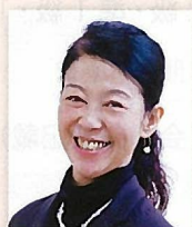
手話あいらんど& 手話パフォーマンスきいろぐみ代表 手話通訳士・手話パフォーマー