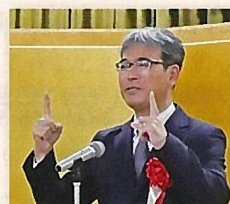
京都市保健福祉局障害保健福祉推進室

最初はカタコトでも、全国手話検定試験は少しずつステップアップできるのが魅力です。音や文字とはまた違う、手話での豊かな気持ちのやり取りを、多くの方に経験して頂きたいと思っています。