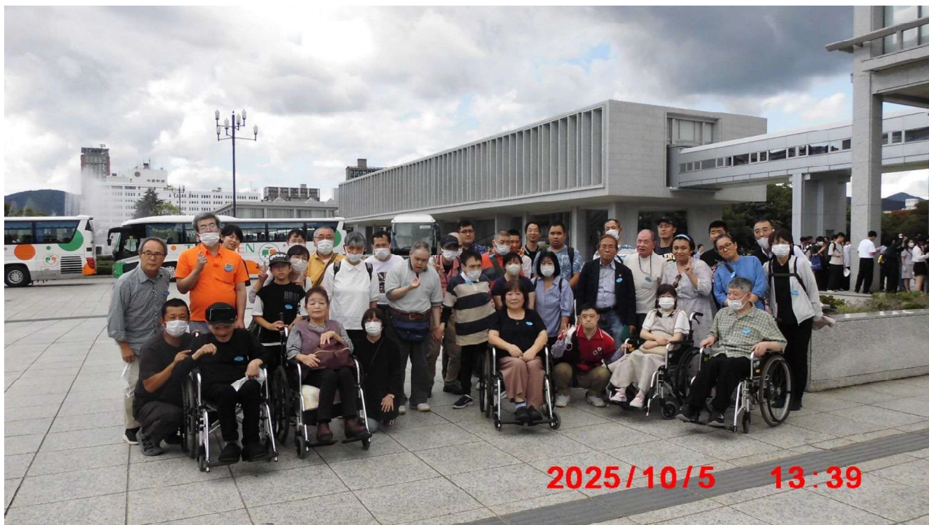
障がい者社会参加推進事業「広島平和記念資料館」にて平和を学ぶ