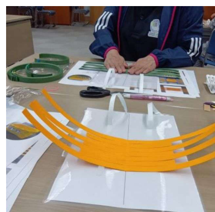
聴覚障がい者セミナー&交流会に参加「クラフトバンドでのかご作り」に挑戦